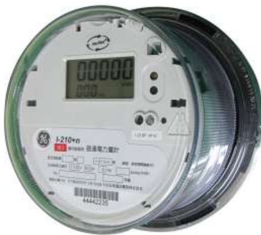
【GE製スマートメーター】